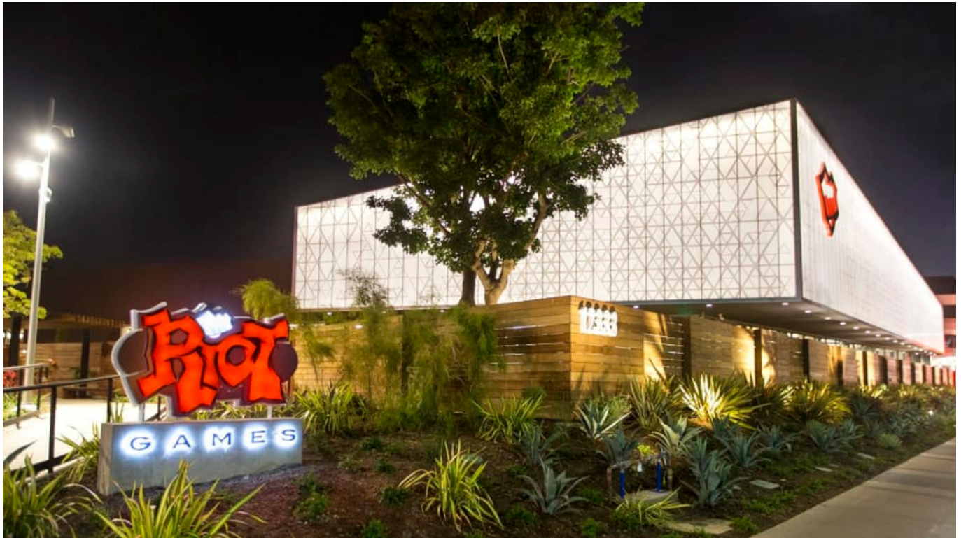
La sede di Riot Games a Santa Monica, California.

Un’altra dipendente ha riferito via email a Kotaku di aver sentito alcune candidate venire descritte come “aggressive” o “troppo ambizione”, mentre nulla è stato detto in merito alle loro effettive abilità. Per quando riguarda i colloqui con gli uomini, non ha mai sentito nulla del genere.