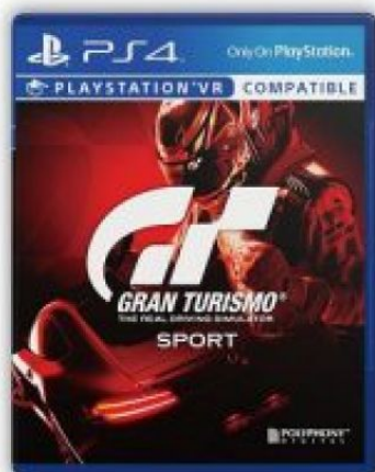
Gran Turismo Sport (中英文合版)