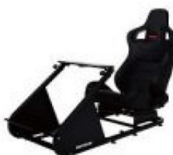
APIGA AP1 專業賽車座椅