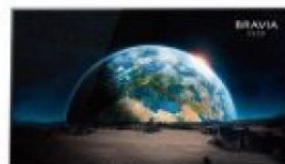
BRAVIA 4K HDR 高畫質OLED電視 KD-65A1