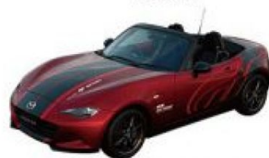
2018年式 MAZDA MX-5跑車 (魂動紅)