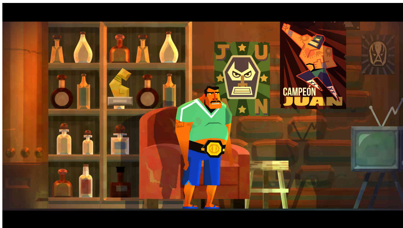
(La frenetica prima parte di Guacamelee 2!)

come i comandi siano incredibilmente reattivi e, senza mezzi termini, perfetti per il sistema di combattimento e combo che Guacamelee 2 pone; per questo motivo, per quanto sia possibile giocare questo titolo in due giocatori con un set di Joy Con , raccomandiamo di giocare in multiplayer con un set per giocatore , in quanto la mappatura dei tasti in questa modalità rappresenta la migliore scelta di gioco (al giocatore servono immediatamente alla pressione 7 degli 8 tasti del controller, in modalità Joy Con singolo uno di questi sarà "L", dunque alla sinistra o alla destra del vostro controller, dipende da quale avete. a disposizione Una vera tortura!). Se volete giocare con questo gioco in multiplayer allora vi converrà giocarci con un amico che come voi possiede Switch , altrimenti dovrete abituarvi a questa astrusa mappatura.